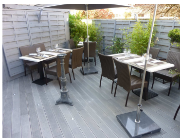
Le 17 Restaurant , 17 rue St Thomas 02-32-33-07-01