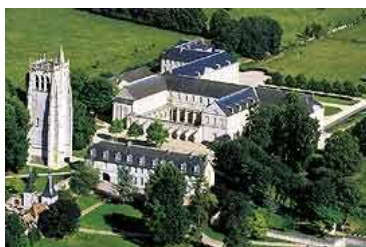
Abbaye du Bec Hellouin